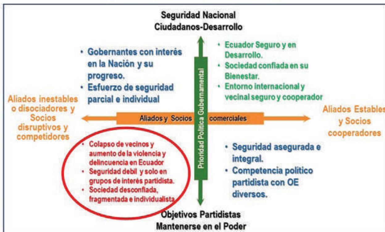
Matriz de los Impulsores A y C