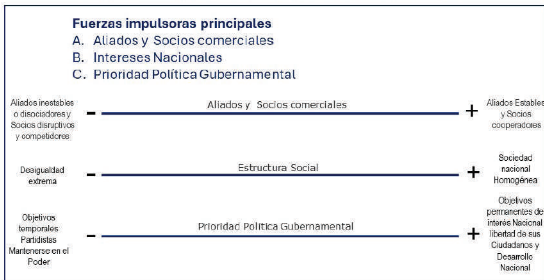
Espectro de las Fuerzas Impulsoras Principales