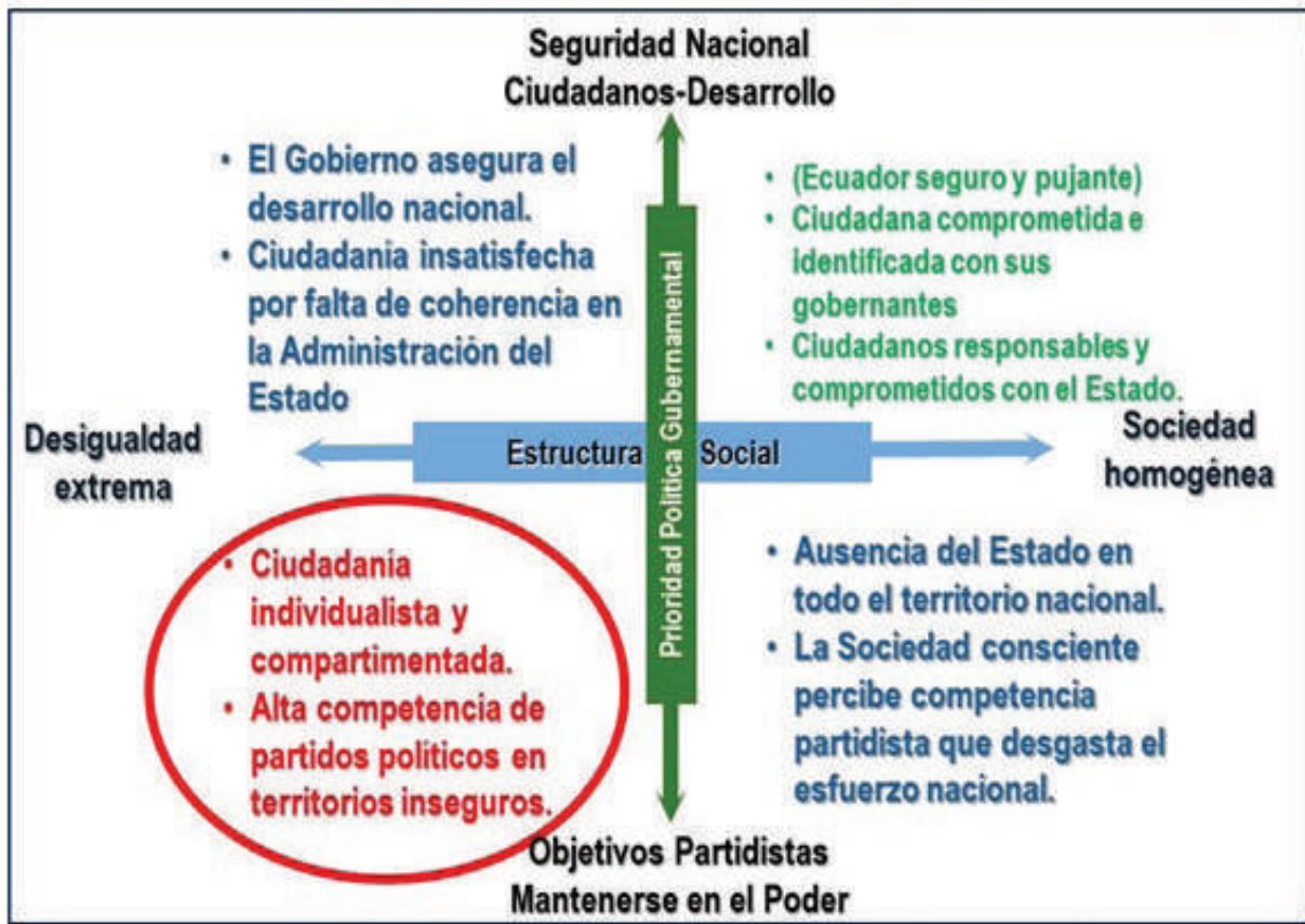
Matriz de los Impulsores B y C

Una vez teniendo a la vista los escenarios posibles, se analizan desde la mirada de la Seguridad Integral y se infieren aquellos escenarios de preocupación por la implicancias negativas para el Estado, como se puede apreciar en figura 6.